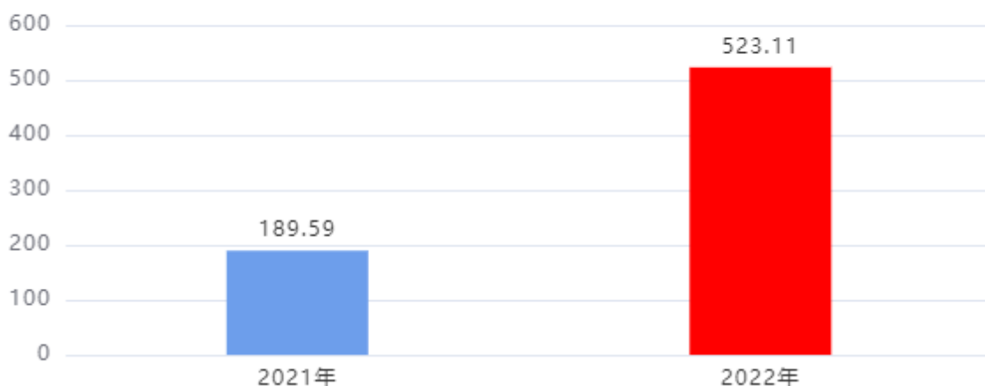
收、支决算总计变动情况图（单位：万元）

2022年度收、支总计523.11万元。与2021年度相比，收、支总计各增加333.52万元，增长175.92%。主要是2022年采购市级应急救援灾物资支出。