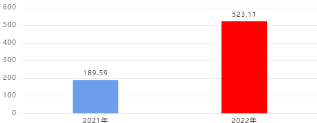
一般公共预算财政拨款支出决算变动情况图（单位：万元）

2022年度一般公共预算财政拨款支出523.11万元，占本年支出合计的100.00%。与2021年度相比，一般公共预算财政拨款支出增加333.52万元，增长175.92%。主要是2022年采购市级应急救援物资支出。