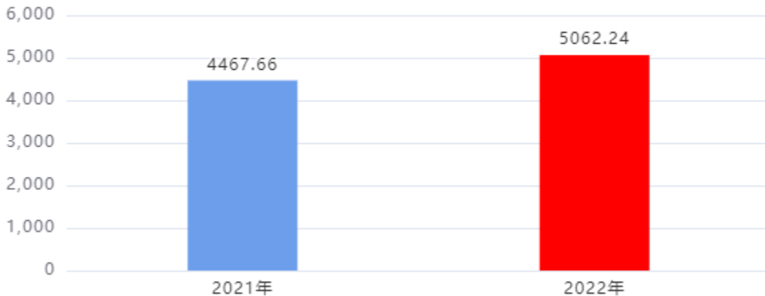
财政拨款收、支决算总计变动情况图（单位：万元）

2022年度财政拨款收、支总计5,062.24万元。与2021年度相比，财政拨款收、支总计各增加594.58万元，增长13.31%。主要是人员增加、人员经费和工资调整。