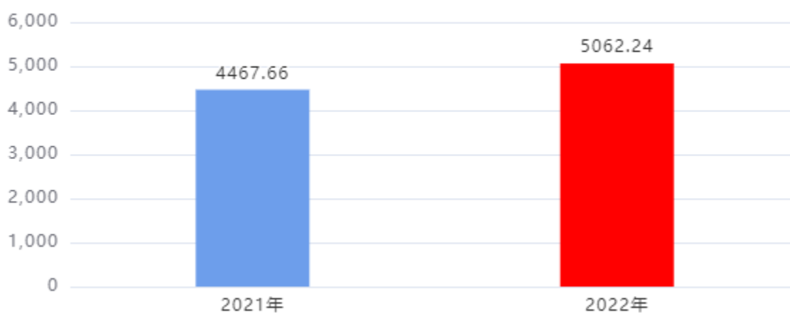
一般公共预算财政拨款支出决算变动情况图（单位：万元）

2022年度一般公共预算财政拨款支出5,062.24万元，占本年支出合计的100.00%。与2021年度相比，一般公共预算财政拨款支出增加594.58万元，增长13.31%。主要是人员增加、人员经费和工资调整。