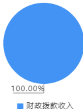
本年收入决算结构图

本年收入合计5,062.24万元，其中：财政拨款收入5,062.24万元，占100.00%。