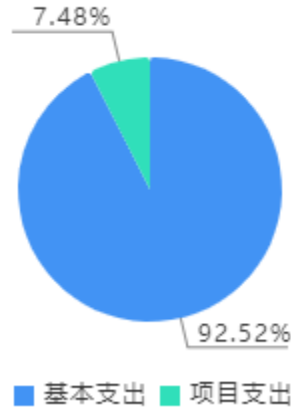
本年支出决算结构图

本年支出合计5,062.24万元，其中：基本支出4,683.55万元，占92.52%；项目支出378.69万元，占7.48%。