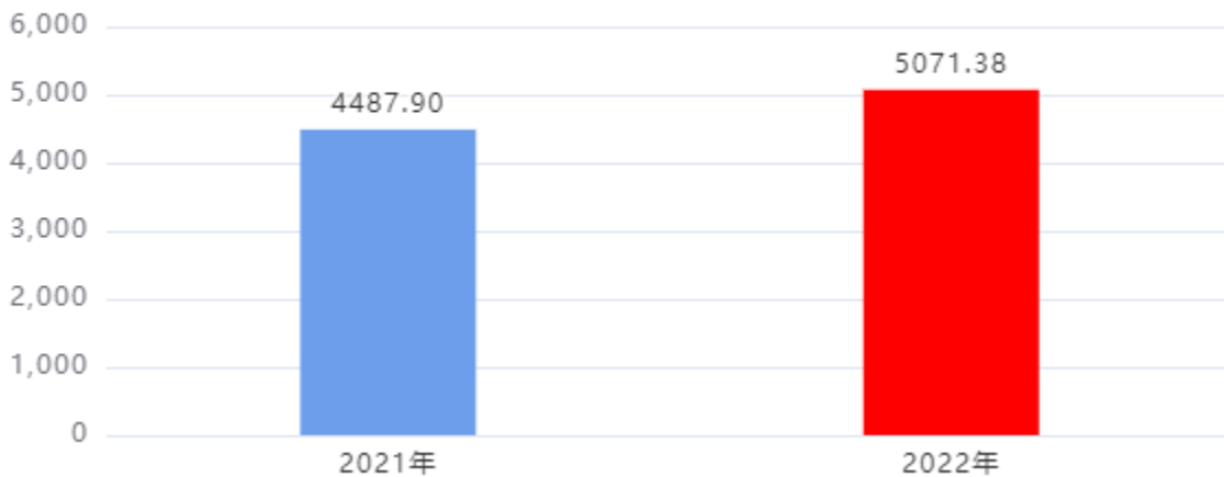
收、支决算总计变动情况图（单位：万元）

2022年度收、支总计5,071.38万元。与2021年度相比，收、支总计各增加583.48万元，增长13.00%。主要是人员增加、人员经费和工资调整。